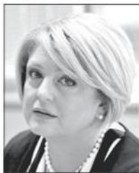
Marina Calderone , presidente del Cup