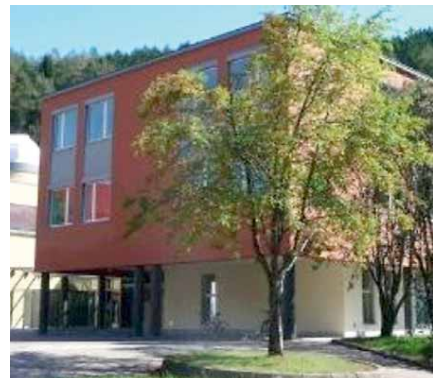
• La scuola media superiore «A. Cantore» di Brunico

do la classifica finale. La manifestazione si chiuderà il 21 marzo prossimo con un evento presso l'ateneo milanese, dove verranno premiati i vincitori insieme ai rispettivi docenti alla presenza di autorevoli rappresentanti del mondo accademico e delle imprese assicuratrici. Nel corso di questa giornata verrà proposto uno spettacolo di edutainment su temi assicurativi e non mancherà un momento di orientamento, in cui verranno illustrati agli studenti i corsi di studio e le opportunità professionali in ambito lavorativo finanziario e assicurativo.